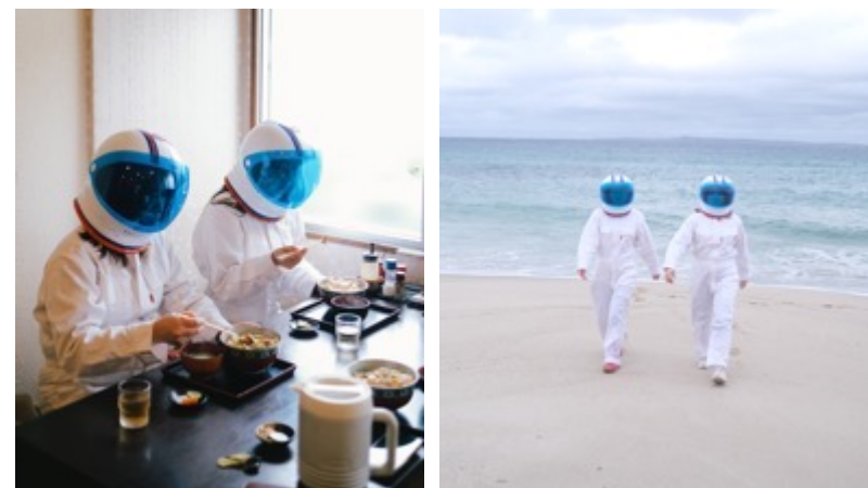
宇宙ヘルメットをかぶった撮影